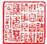
陳 秀 莉