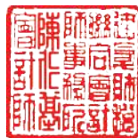
陳 仁 基