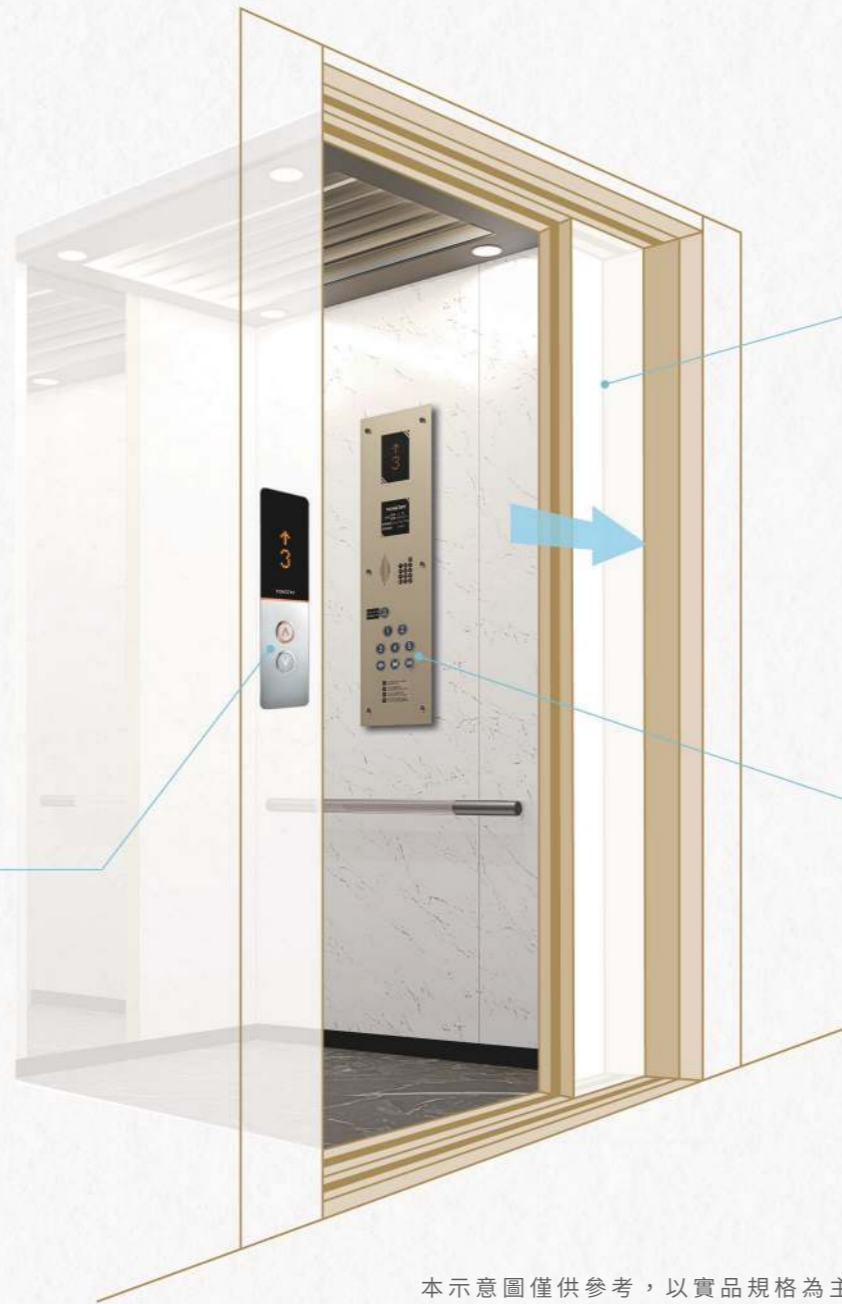
本示意圖僅供參考，以實品規格為主